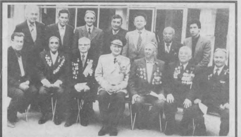
На снимке: узбекистанцы-сталинградцы среди преподавателей ташкентской школы №22. В центре - генерал-лейтенант Сабир Ахунджанов.