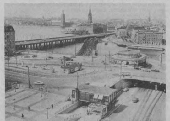
Стокгольм называют еще Северной Венецией: многочисленные каналы делают его на двадцать больших и малых островов. НА СНИМКЕ: шведская столица с высоты птичьего полета. Или, если угодно, - с высоты полета Карлсона...