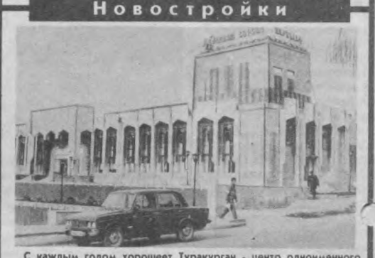
С каждым годом хорошеет Туракурган - центр одноименного района Наманганской области. Поднимаются новые административные и жилые здания, социально-бытовые объекты, украшающие город. Среди них и Дворец культуры "Ширинкин" одноименной агрофирмы. На снимке: Дворец культуры "Ширинкин".