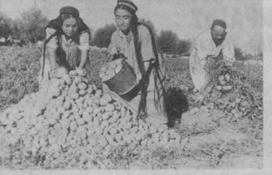
Сбор картофеля в колхозе имени Ленина Ташкентского района.