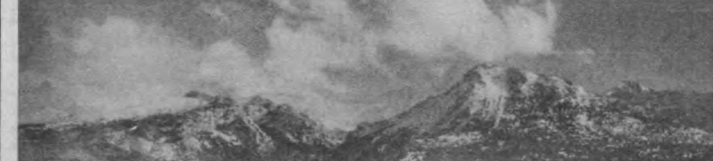
Заминский парк. Урочище Шаршара.