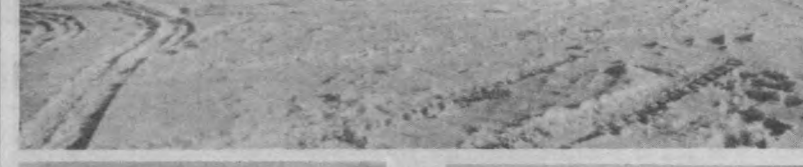
Заминский парк. Урочище Шаршара.