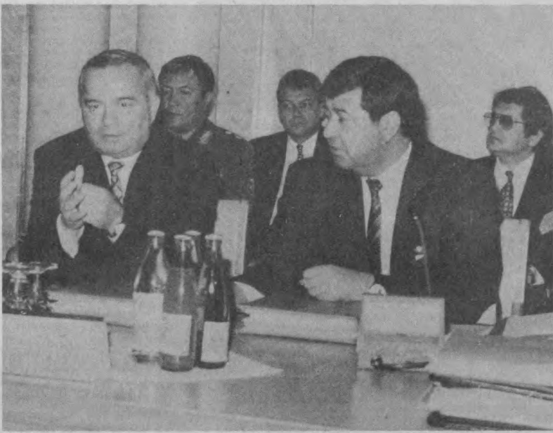
отношении, созданием общественной базы экономического союза, совершенствовании тарифной политики в межгосударственном сообщении на железнодорожном транспорте, сотрудничестве в области кинематографии, книгоиздания, киносъемочного пространства, полиграфии и другие проблемы.

На совете глав правительств были рассмотрены вопросы, связанные с взаимным правовым урегулированием хозяйственных