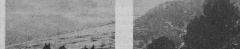
Заминский парк. Урочище Шаршара.