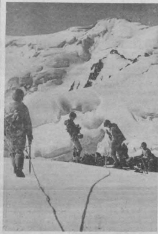
Перед последним броском.

Различные организации Самаркандской области в честь 50-летия Великой Победы устанавливали льготы для ветеранов войны и труда. Готовы бесплатно обслужить участников войны и трудового фронта все юридические консультации нашей области.