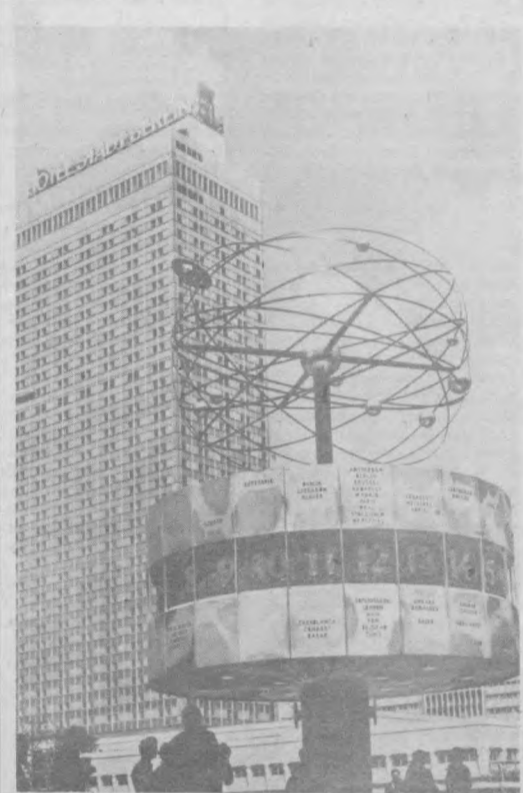
Знаменитая берлинская площадь Александерплац названа в честь победителя Наполеона российского императора Александра I.

Своей современной облик площадь обрела в социалистические времена как центр Восточного Берлина.