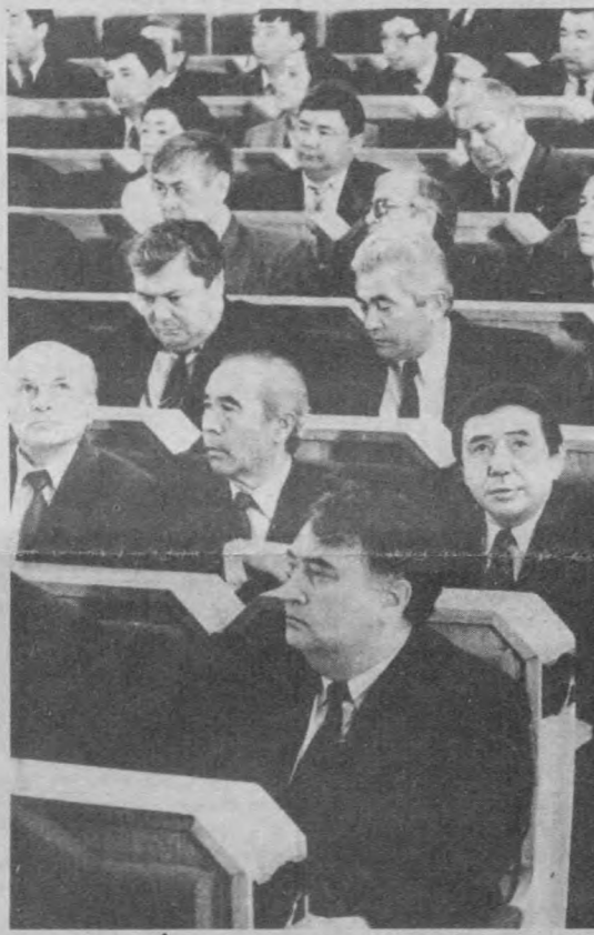
НА СНИМКЕ: в зале заседаний сессии.

На этом первая сессия Олий Мажлиса Республики Узбекистан первого созыва завершила свою работу.