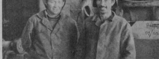
Второе рождение завода

Мне часто снится поселок Научно-исследовательского технического института близ Уртаула.