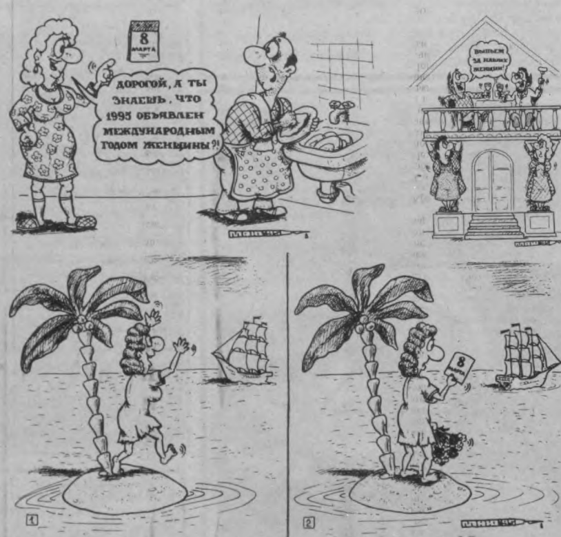
Рис. Александра Маркелова.