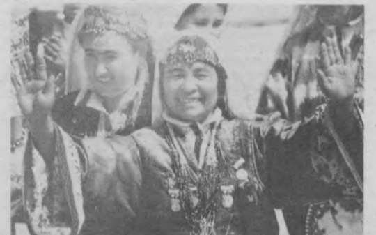
На снимке: веселись, народ, Навруз идет!