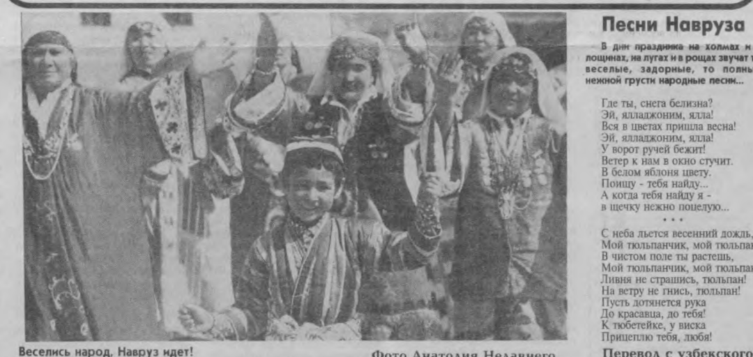
Веселись народ, Навруз идет!