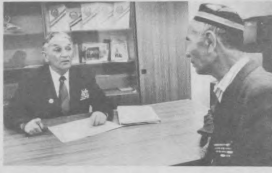
Махалля "Навуруз" отмечает день своего второго рождения