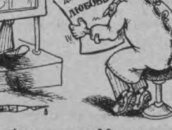
Рис. Александра Маркелова.