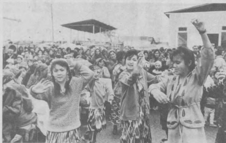
Праздник Навруз в колхозе имени Гуломмахмуда Абдуллаева Ташкентского района столичной области.

Вот и пришел в наш край всенародный праздник Навруз. Он еще раз продемонстрировал ценность и самобытность вековых традиций народа. Пусть дух Навруза, настроение Навруза не покинут наши сердца.