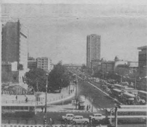
Бомбей - второй по величине город Индии, крупнейший промышленный и морской порт страны.