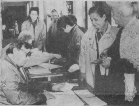
На снимках: на избирательном участке №411 Чиланзарского района Ташкента.