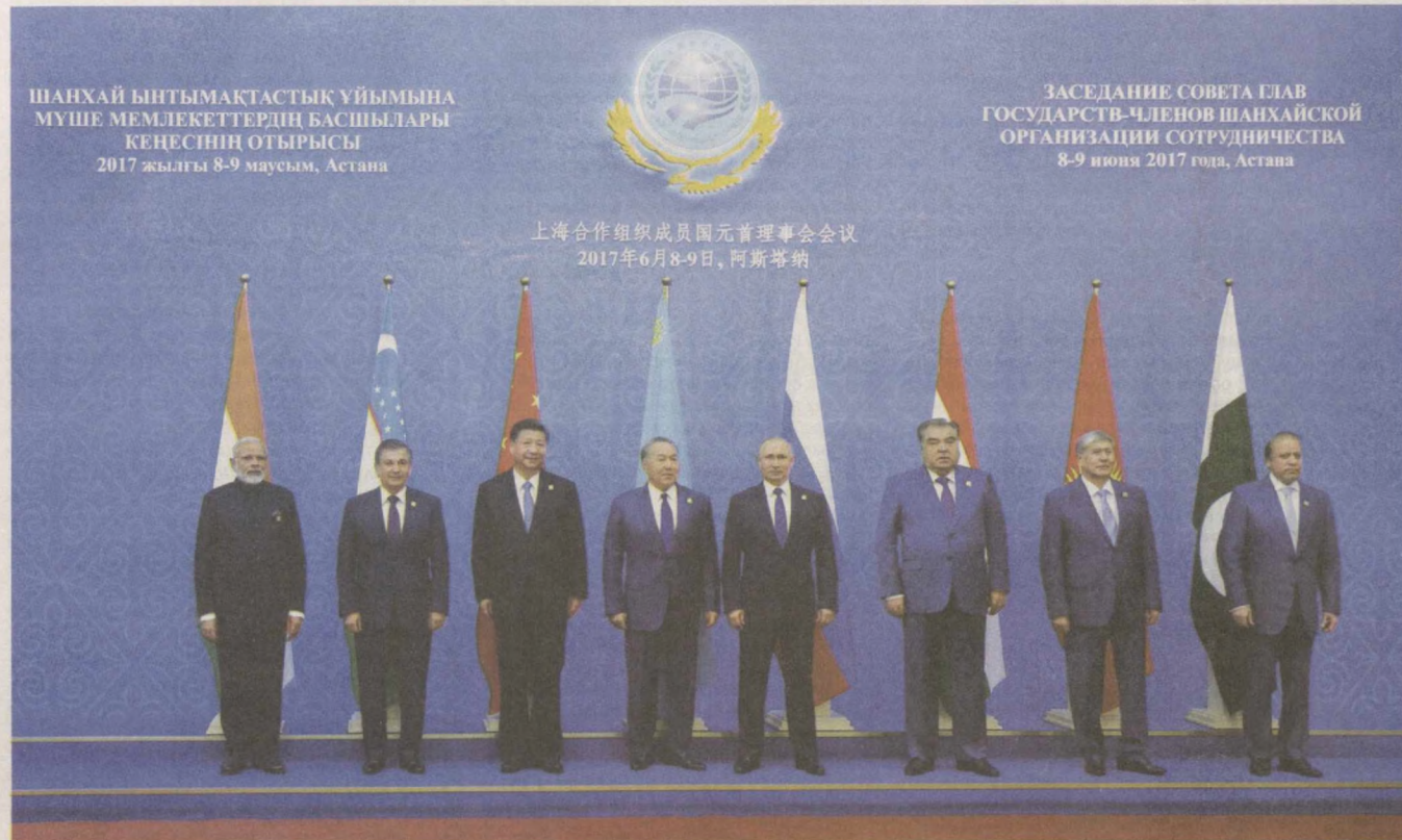
ШАНХАЙ ШЫТМАКТАСТЫК УЙЫМЫНА МҮШЕ МЕМЛЕКЕТТЕРДИҢ БАСШЫЛАРЫ КЕҢЕСИНИҢ ОТЫРЫСЫ 2017 жылғы 8-9 маусым, Астана