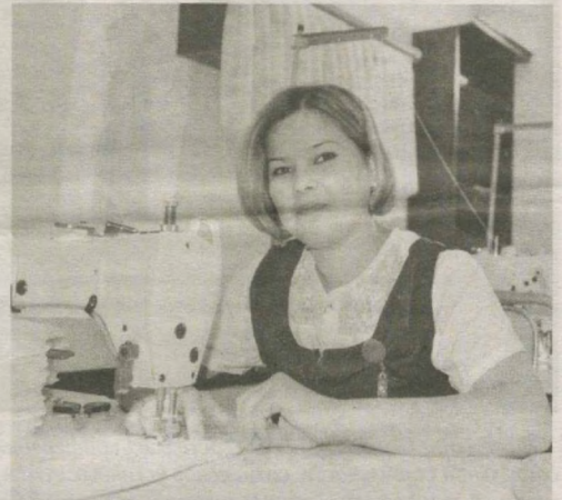
Самаркандская область.

В дальнейшем в ООО "Net Product Lux" планируется также выпуск постельных принадлежностей и полотенец для гостиниц.