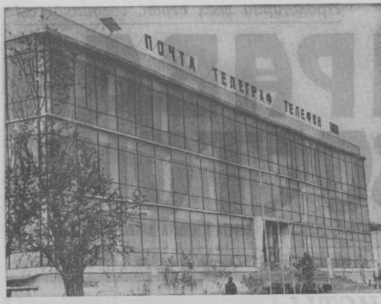
ПО ГОРОДАМ УЗБЕКИСТАНА. Новая Бухара. Здание почты, телеграфа и телефона.

дой первичной организации. Комитеты комсомола Гулистанской городской, Шерабадской, Пахтакорской, Хивинской районных организаций недостаточно следят за своевременным снятием с учета выбывших членов ВЛКСМ. Вместо кропотливой работы с каждым комсомольцем здесь пытаются освободиться от тех, кто по разным причинам не участвует активно в комсомольской жизни. Отдельные комитеты комсомола еще слабо используют Ленинский зачет, общественно-политическую аттестацию в целях повышения активности комсомольцев, приобщения их к делам организации. Начавший обмен комсомольских документов требует дальнейшего повышения уровня руководства комсомолом, выработки форм и методов, соответствующих требованиям дня. В ходе обмена документов комсомольцы должны получать всемерную помощь и поддержку партийных организаций, в полной мере использовать их большой опыт. А. РУДЕНКО. Инструктор ЦК Компартии Узбекистана.