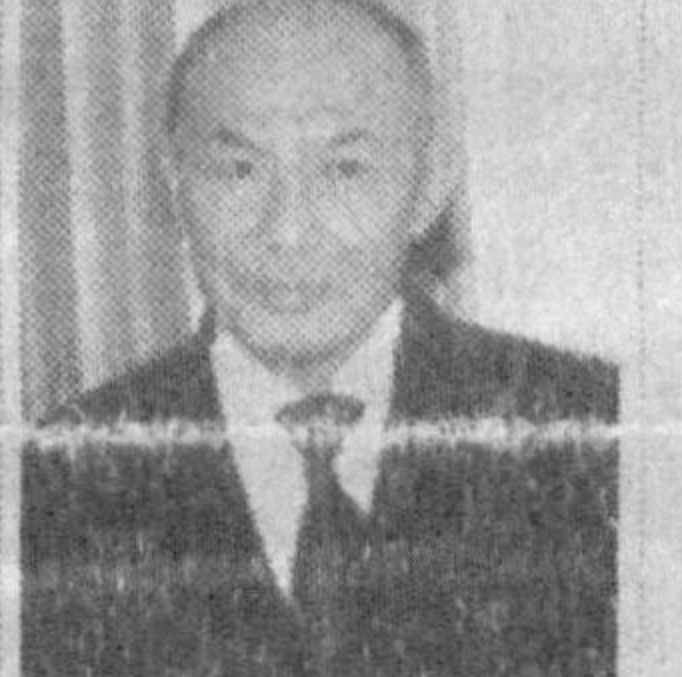
Абдулла ОРИПОВ, Ўзбекистон Ёзувчилар уюшмаси раиси, Ўзбекистон Қаҳрамони, халқ шоири: — Ким қандай тушунса тушунар, аммо кўнглимдаги айтаман: меннинг ҳаётим жамият билан чамбарчас боғланган. Ватанимда содир бўлаётган ҳар бир янгилик, воқеа, тарихий тараққиёт қалбимда

Ушбу ҳаяжонли лаҳзаларда қалбда нузли туйғулар уйғонади. Умиримизнинг ўтган бир йили давомида қилинган ишлар, эришилган ютуқлар ҳаёлга келади: янги орзулар пайдо бўлади. Янги йил арафасида ватандошларимиздан бир гуруҳига қуйдаги икки савол билан мурожаат этдик: 2003 йил ҳаётингизда қандай из қолдирди? Янги йилда нималарни орзу қиляёсиз? Ўз акс-садосини беради. 2003 йилда кунчиқар мамлакат — Японияда бўлиб қайтдим. Жаҳонга машҳур Сока университети профессори уновонига сазовор бўлдим. Япон адабиёти, санъати, маданиятининг улуг намоёндалари билан учрашиб суҳбатлашдик. Ушбу сафар бир ижодкор сифатида меннинг ҳаётимда унутилмас из қолдирди. Утган йилнинг яна бир муҳим воқеаси, шеърларим жамланган тўплам рус тилида нашр этилди. Бу эса халқларимиз ўртасидаги дўстликни мустаҳкамлашда ўзига хос ўрин тутди. Ўқувчиларнинг хабари бор,