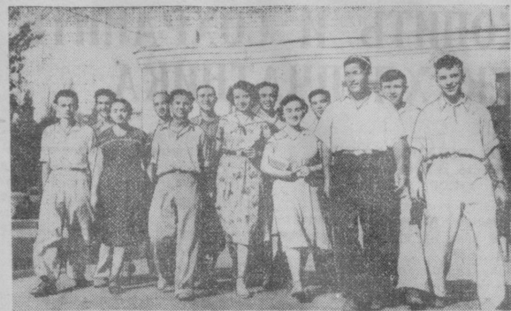
15 июля из Ташкента выехала первая группа студентов на уборку урожая в Акмолинскую область. На снимке: студенты Среднеазиатского политехнического института, уезжающие на сбор урожая.

В прошлом году Ташкентская киностудия впервые решила дублировать художественный фильм «Гульбахор».