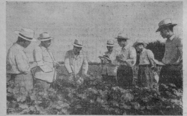
Пребывание в Узбекистане гостей в Советском Союзе по приглашению Министерства сельского хозяйства СССР делегации работников сельского хозяйства Кореяской Народно-Демократической Республики.