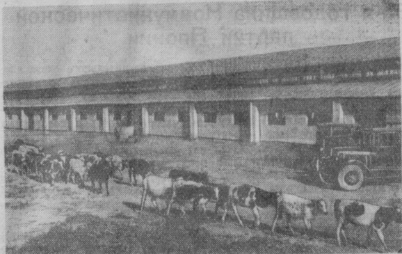
На снимке: новая животноводческая ферма колхоза имени Ахунбабаева, Сыр-Дарьинского района.