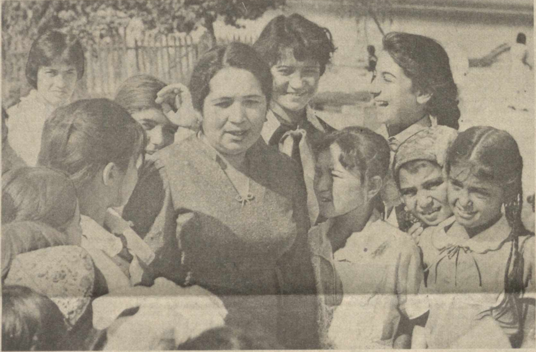
Рус тилини эркин билиш ўрта ўқув юрталарини тамомлаётган ёшлар учун норма бўлиб қолган керак. Умумий таълим ва ҳунар мактабининг ислоҳ қилишининг асосий йўналишларидан бири бўлишига асосан шу вази-фани ички амалга ошириш