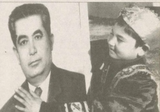
Мой дедушка.