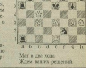
Мат в два хода. Ждем ваших решений.