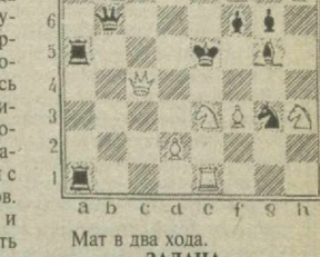
Мат в два хода. ЗАДАЧА