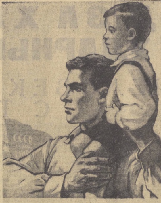
Я хочу, чтоб сын НЕ ЗНАЛ ПРОБЛЕМЫ!

Славно потрудился многотысячный коллектив строителей и монтажников предприятий и организаций Министерства строительства Узбекской ССР в первом полугодии четвертого года семилетия. Полугодовой план строительства жилищных работ выполнен по министерству на 101,9 процента.