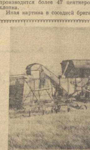
Заканчивается уборка хлебов в одном из крупнейших совхозов республики — «Гала-Арал» № 1 Самаркандской области. В этом опорно-показательном хозяйстве под зерновыми заняты 21 тысяча гектаров. На снимке справа — переборка зерна скреповым транспортером.

Л. КОРСУНСКИЙ. Соб. корр. «Правды Востока» по Каракалпакской АССР. Туркунский район.