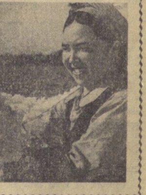
ГЛАВНЫЙ КОНСТРУКТОР ХЛОПКОУБОРОЧНОЙ МАШИНЫ «ХВС-1,2»

2,5—3 тонны — ТАКОЕ КОЛИЧЕСТВО ХЛОПКА СОБИРАЕТ В СРЕДНЕМ ЗА ДЕНЬ МЕХАНИК-ВОДИТЕЛЬ ХЛОПКОУБОРОЧНОЙ МАШИНЫ „ХВС-1,2“ 60—70 килограммов — ПРОИЗВОДИТЕЛЬНОСТЬ ТРУДА ОДНОГО ЧЕЛОВЕКА ПРИ РУЧНОМ СБОРЕ СЫРЦА