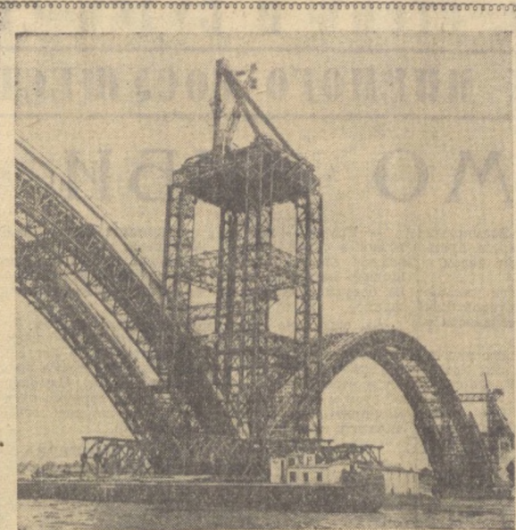
В Рыбинске сооружается мост через Волгу. На его строительстве применяются очень тяжелые железобетонные конструкции...