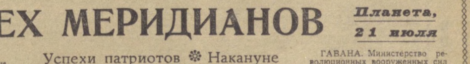
Планета, 21 июля

В Кунграде ведется сооружение крупной перевалочной базы, которая станет трамплином для штурма Узбекистана.