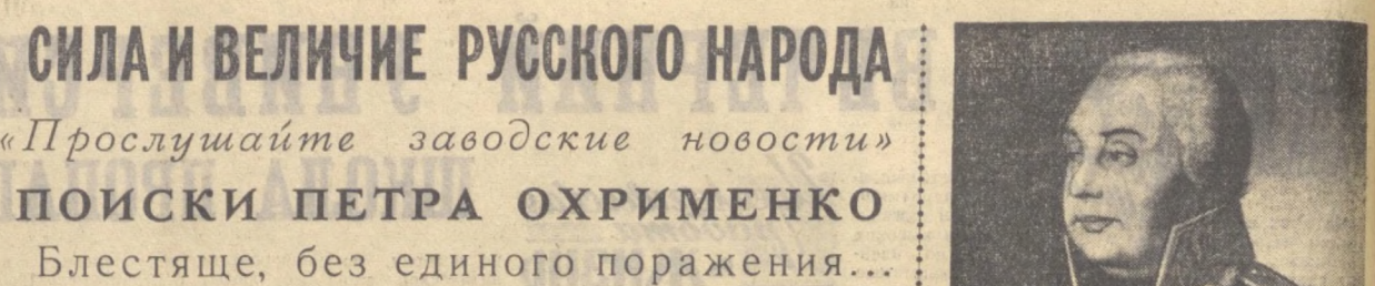
Кутузов Михаил Илларионович — гениальный русский полководец, один из создателей передового русского военного искусства.

Возьму Россию за ноги, если я овладею Петербургом, я возьму Россию за голову, заняв Москву, я поражаю ее в сердце». И грозная наполеоновская армия устремила к сердцу России — к Москве. Против вторгнувшегося неприятеля на западной границе находилось немногим более 200 тысяч русских солдат, в три раза меньше, чем было у противника. Трудное стратегическое положение, трехкратное численное превосходство сил врага вынудили русское командование принять решение отойти в глубь страны. Остатки русских армии, как указывал К. Маркс, были «делом не свободной воле, а суровой необходимостью».