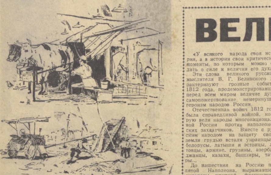
Колхоз «Политотдел» Верхнекочкорского района сегодня. На рисунке: на первом — колхозный животноводческий городок, на втором — доильная установка «Колхоз»; на третьем — сортировка бобов на колхозном току.