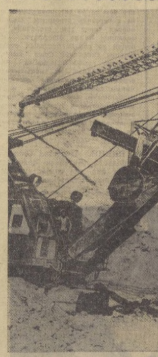
В Голодной степи, на границе двух братских республик, полным ходом идет строительство Чардарьинского водохранилища. Одновременно здесь сооружается мощная ГЭС. Недалек день, когда живительная влага пойдет в хлопководские хозяйства Казахстана и Узбекистана. НА СНИМКЕ: экскаватор за работой.

Р. ПЛУНГАН, Специальный корреспондент «Правды Востока».