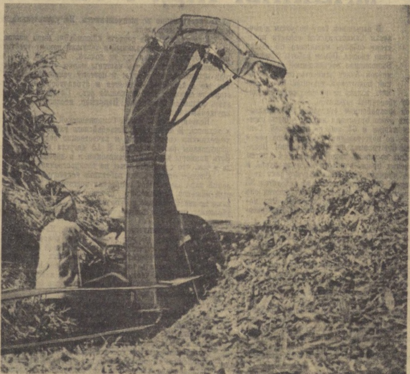
Колхоз имени В. И. Ленина, Залужка кукурузы в силосные ямы.

Я. ГУМЕННЫЙ. Внештатный корреспондент «Правды Востока».