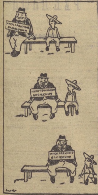
«Политика» — так озаглавлена карикатура в мексиканской газете «Диас»...