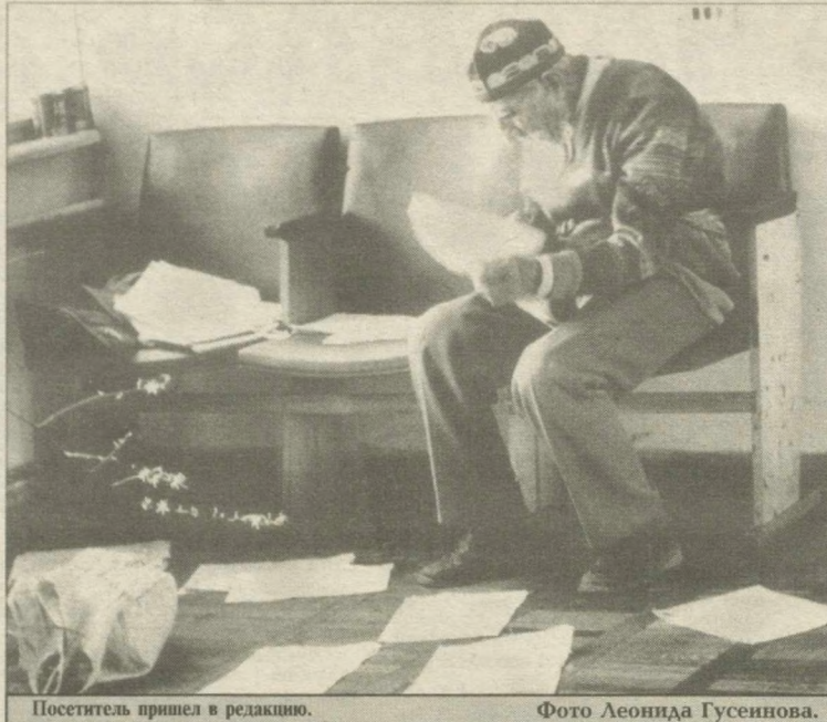
Посетитель пришел в редакцию.