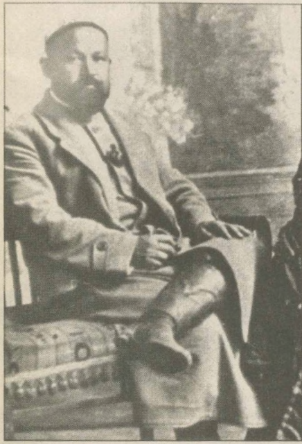
К 85 - ЛЕТИЮ НАЦИОНАЛЬНОГО УНИВЕРСИТЕТА УЗБЕКИСТАНА

21 апреля 1918 года - в этот день в Ташкенте был торжественно открыт Народный университет, который по мысли лучших представителей туркестанской интеллигенции должен был коренным образом отличаться от высших учебных заведений прежнего типа. Вышедшая тогда в Ташкенте «Наша газета» (№ 60, 1918 год) писала: «В нем должно быть все, начиная от обучения грамотности и заканчивая высшими науками и специальными техническими курсами (школами) по разным специальностям, для подготовки к инстинктивной деятельности лиц по разным отраслям труда».