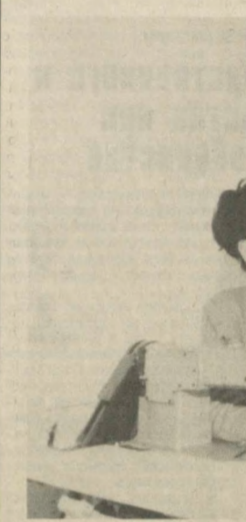
Частная фирма "Ишонч", заработавшая в Карише, еще очень молода. Но ее продукция уже успела стать популярной среди населения. Жилеты, лечебные пояса, одежда из верблюжьей шерсти и другие изделия из натуральной шерсти, так и за ее пределами.