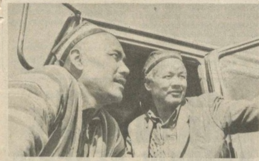
Успешно провели посевную хлопководы колхоза имени Акмата Икрамова Мурабадского района Сурхандарьинской области.

Своевременное и качественно проведенные агротехнические и отличная погода, установившаяся во время сева, дают основание к получению высокого урожая. Кроме хлопчатника, в многоотраслевом хозяйстве выращивают различные виды колосовых, хорошо развито здесь и животноводство.