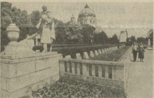
В апреле исполнилось 50 лет освобождения Советской Армией столицы Австрии Вены от немецко-фашистских захватчиков. Могила советских воинов, павших в боях за Вену (снимок сверху). Грабен - одна из оживленных торговых улиц австрийской столицы (снимок внизу).