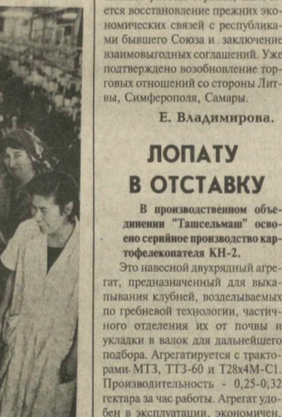
Динзская чулочная фабрика бесперебойно выдает продукцию. Ежедневно здесь выпускают 30 тысяч пар изделий. Мужские, женские, детские носки, колготки для малышей - товары 15 наименований не залеживаются на прилавках магазинов. Тем более что по качеству они не уступают импортным, а цена на них вполне приемлемая. Секрет стабильной работы фабрики очень прост: здесь трудятся инициативные, деловые, квалифицированные специалисты, способные вовремя обеспечивать поставки сырья, совершенствующие технологию.