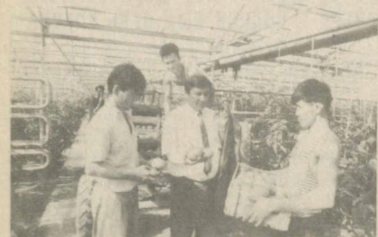
К решению экологических проблем региона Приаралья подключилось тепличное хозяйство "Каракалпактан", расположенное в Нукусском районе. В ближайшее время здесь начнет действовать новая опреснительная установка для полива в теплицы очищенной от солей воды. Как считают специалисты, установка не только будет способствовать выращиванию экологически чистой сельскохозяйственной продукции, но и повысит ее урожайность. Для этого же решено наладить здесь производство биогумуса. "Каракалпактан" располагает 12 гектарами теплиц, на которых в год производится около 300 тонн высококачественных овощей. Свежие помидоры, огурцы, болгарский перец, зелень в любое время года поступают отсюда к стогу городов. Отправляют свою продукцию земледельцы и в соседние республики. По бартеру получают в обмен товары народного потребления.