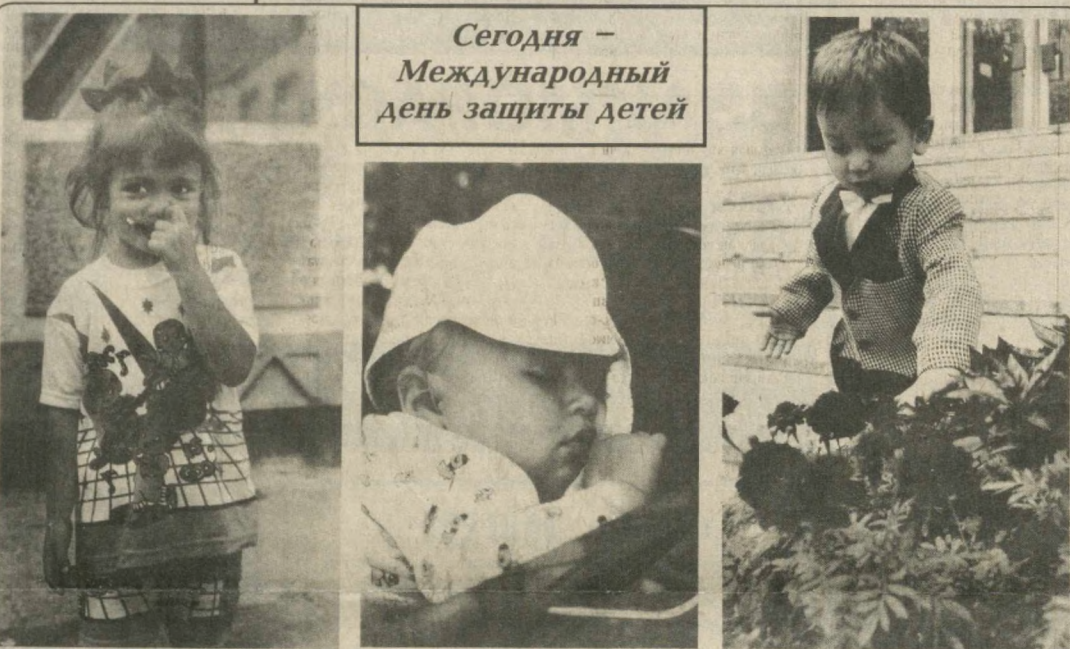
Такие наши дети.