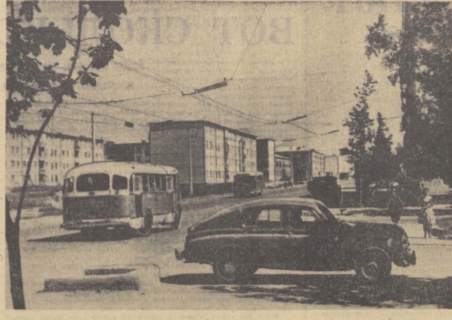
ТАШКЕНТ. Чилангар сегодня.