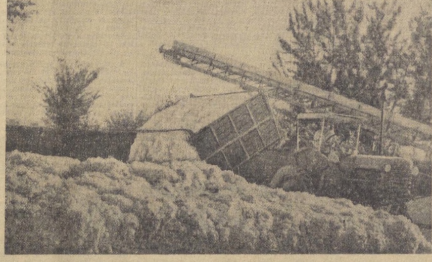
Непрерывным потоком поступает в закрома Родины хлопок нового урожая...