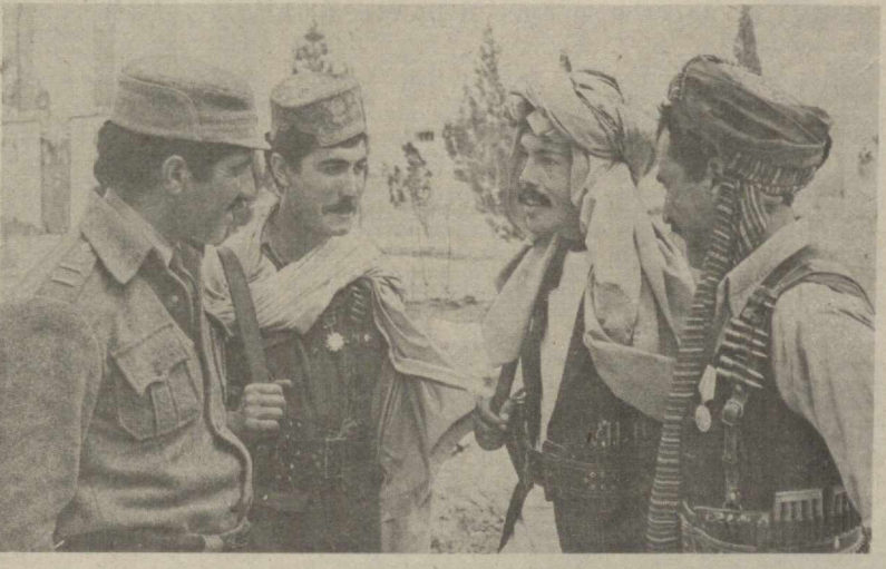
Афғонистон Демократик Республикасида қўшни Покистон орқали хуруж қилган, Америка империализми ва реакцион кучлари қўллаб-қувватлаётган душманларга қарши курашда кучгарачиларга аҳоли таянч кучи бўлмоқда. Қарбийлар эса ўз навбатида деҳқонларга дала ишларнида қўллашмоқдалар, уларга Афғонистон Халқ Демократик партиясининг снэсатини тушунтирмоқдалар. Суратда: катта

Бош Ассамблеяси Совет Иттифоқининг ташаббуси билан муштамлақ мамлакатлар ва халқларга мустақиллик бериш тўғрисидаги тарихий декларация қабул қилинганлигининг 25 йиллиги муносабати билан махсус юбилей мажлиси ўтказди. Мажлисда КПСС Марказий Комитети Бош секретари М. С. Горбачевнинг мажлис қатнашчиларига йўллаган мактуби зўр эътибор билан кўтиб олинди. Мактуб БМТ Бош Ассамблеяси ва Халқсизлик Кенгашининг расмий ҳужжати сифатида нашр этилди. (ТАСС)