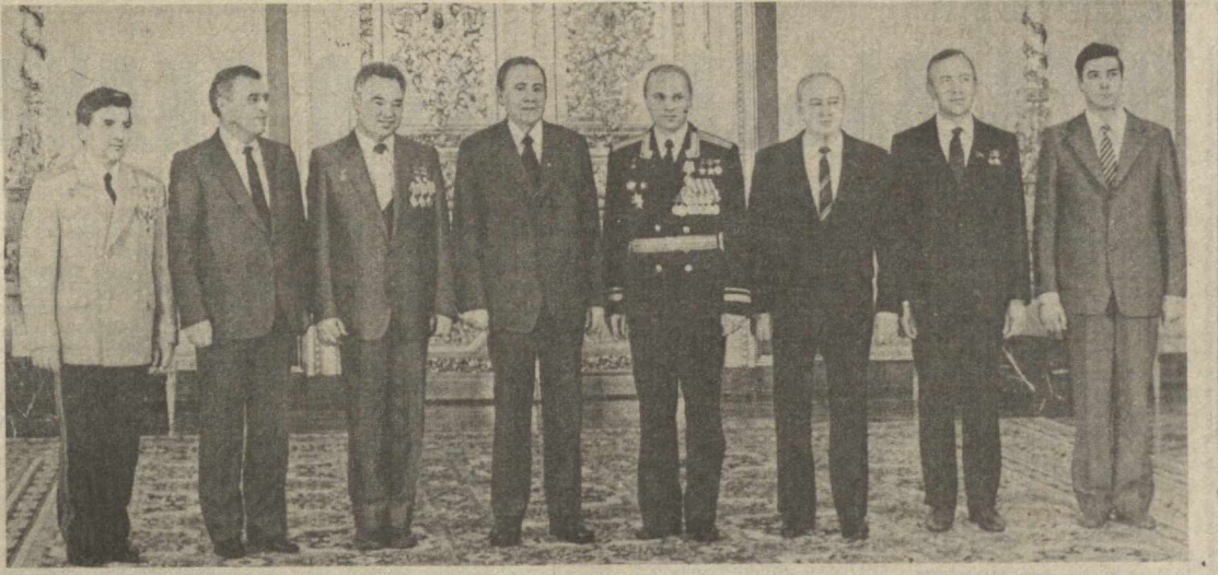
Мукофотларни тошпирдиш пайти. (ТАСС — ЎзТАГ телефо тоси).

18 октябрь куни Кремлда КПСС Марказий Комитети Сисий бюросининг аъзоси, СССР Олий Совети Президиумининг Раиси А. А. Гро-мико В. А. Жоникбеков билан Г. М. Гречкога Ватаннинг юксак мукофоти — Ленин орденини тошпирди.