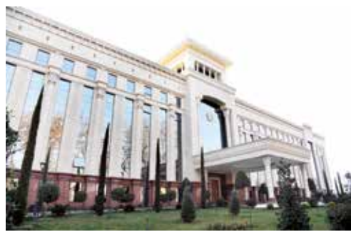
Oliy Majlis Senatining Fan, ta'lim va sog'liqni saqlash masalalari qo'mitasining majlisi bo'lib o'tdi.