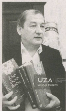
«Al-Jome' as-Sahih»ning arab va indonez tillaridagi nusxasi keltirildi