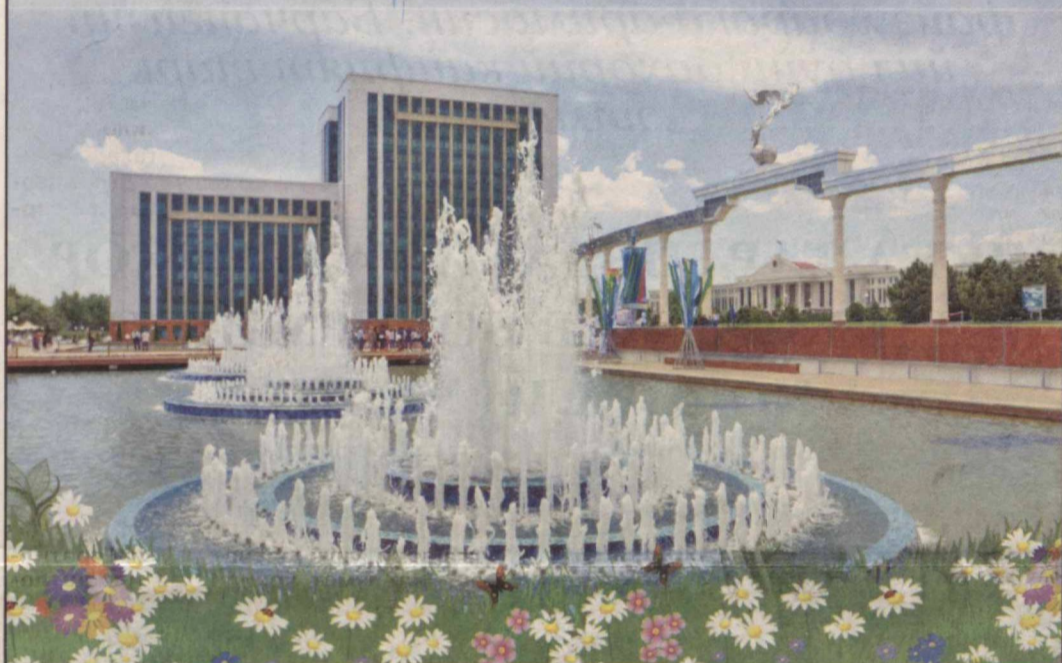
“ТОШКЕНТ ФАВВОРАСИ” ДАВЛАТ УНИТАР КОРХОНАСИ ЖАМОАСИ

Баҳорий кайфият йил бўйи қалбингизни тарк этмасин, хотиржамлик, бахту иқбол ҳамиша ҳамроҳингиз бўлсин, азизлар!