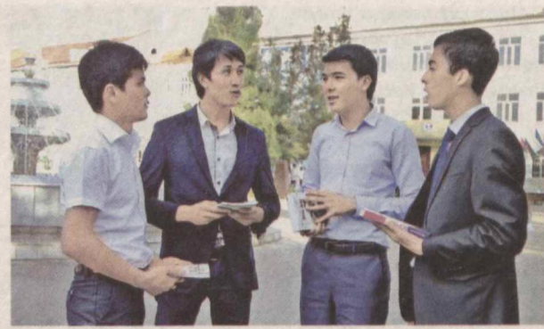
“Ўзбекистон ва Хитой: “Бир макон, бир йўл” ташаббусини ҳамкорликда амалга ошириш истиқболлари” мавзусидаги халқаро конференцияда иштирок этиш учун мамлакатимизга келган Хитой Халқ Республикаси делегацияси Тошкент давлат шарқшунослик институтида учрашув ўтказди.

Тадбир доирасида республикамизнинг турли жабҳаларида фаолият юритиб келаётган давлат корхона ва ташкилотлари ўзларининг кўргазмалы материаллари билан қатнашди. Зарина РУСТАМОВА