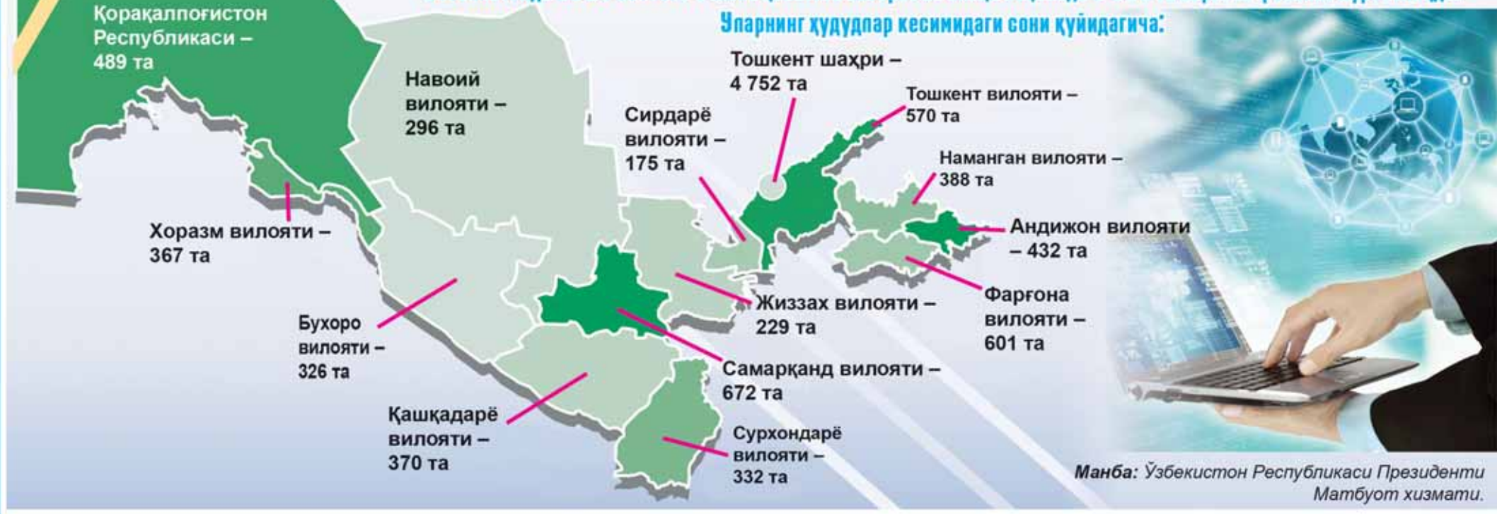
Манба: Ўзбекистон Республикаси Президентини Матбуот хизмати.

Уларнинг ҳудудлар кесимидаги сони қуйидагича: