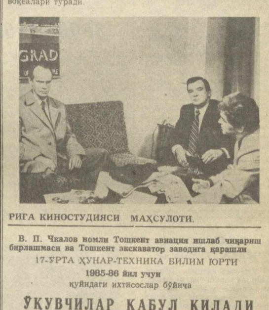
РИГА КИНОСТУДИЯСИ МАҲСУЛОТИ.