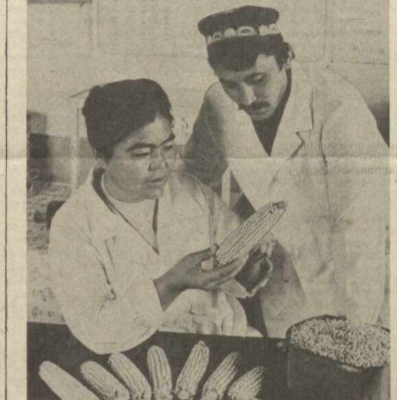
АНДИЖОН. Жалолқудук районда И. Охунбоев номи янги мактабхўхори домини саралайдиган завод қурилиш, ишга туширилди.