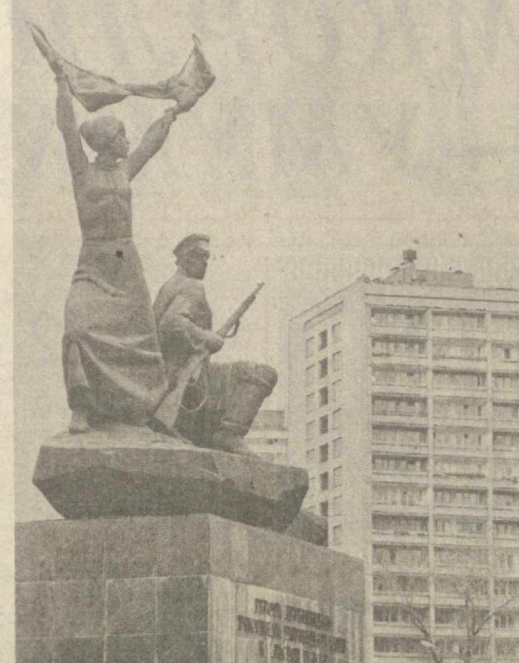
С. РАХИМОВ. Москвадаги баррикада жангида қатнашган қаҳрамон аристонларнинг хотирасига ўрнатилган ёдгорлик.