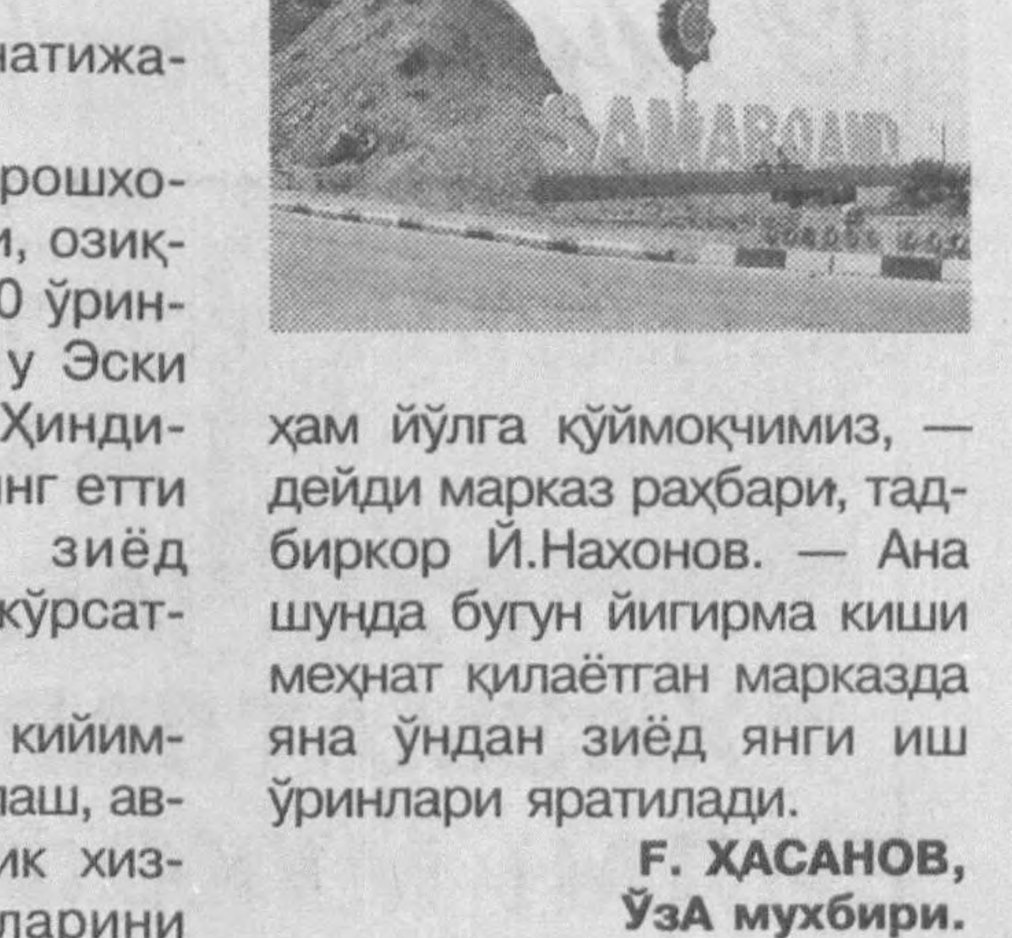
Ҳам йўлга қўймоқчимиз, — дейди марказ раҳбари, тад-биркор Й.Нахонова. — Ана шунда бугун йиғирма киши меҳнат қилаётган марказда яна ўндан зиёд янги иш ўринлари яратилади. Ғ. ХАСАНОВ, ЎЗА муҳбири.

шундай эътибор натижа-сидир. Марказда сартарошхо-на, гўзаллик салони, озик-овқат дўкони ва 800 ўрин-ли тўйхона бўлиб, у Эски Жума, Оқманғит, Ҳинди-бой маҳалларининг етти минг нафардан зиёд аҳолисига хизмат кўрсат-моқда. — Тез кунларда кийим-ларни қиммат тизимига, ав-томобилларга техник хиз-мат кўрсатиш ишларини