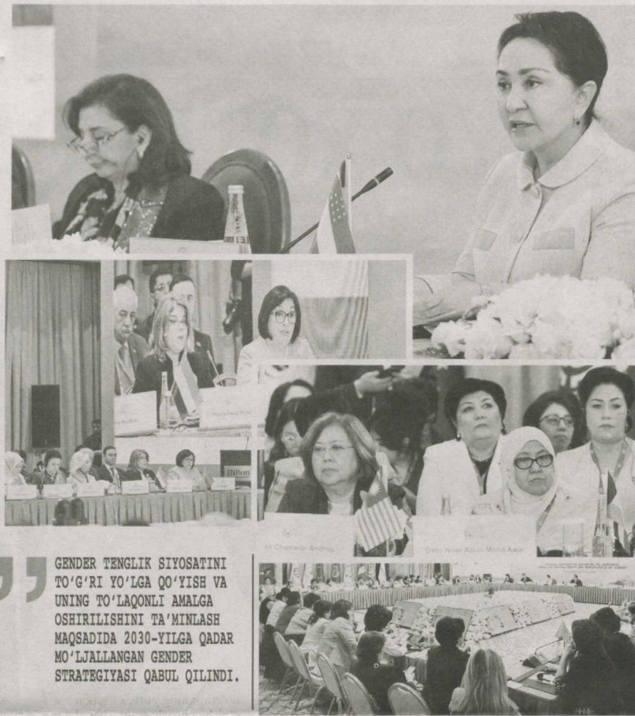
GENDER TENGLIK SIYOSATINI TO'G'RI YO'LGA QO'YISH VA UNING TO'LAQONLI AMALGA OSHIRILISHINI TA'MINLASH MAQSADIDA 2030-YILGA QADAR MO'LJALLANGAN GENDER STRATEGIYASI QABUL QILINDI.