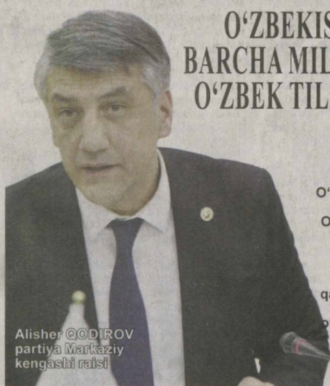
Alisher QODIROV partiya Markaziy kengashi raisi