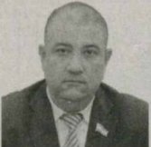
Ғайрат САҒАРОВ, Олий Мажлис Конунчилик палатаси депутати