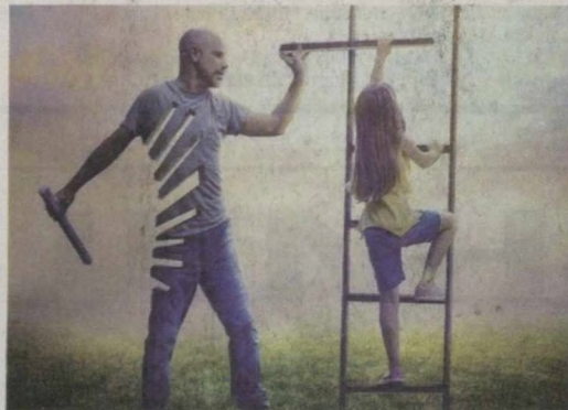
Ота – сиз ҳоҳлаган нарсани бера олмасан ҳам ўзида борини берадиган зот.

Бир чимдим кулги Амалдор чекка бир кишлокка сайёр қабулга бориб, одамлар билан учрашибди. – Қандай муаммоларингиз бўлса, ҳал қилиб берамиз. – Бизда иккита катта муаммо бор, – дебди бир оқсоқол. – Аввало, бизда шифохона бору, шифокор йўқ. Амалдор шартта мобил телефонидан кимнингдир рақамини терибди-да, бир четта ўтиб 1-2 дақиқа гаплашибди. – Бу масалани гаплашиб ҳал қилдим. Шифокор эртагаёқ шу ерда бўлади. Энди иккинчи эhtiёжингизни айтинг-чи? – Кишлогимизда мобил алоқа мутлақо ишлайми, – дебди оқсоқол.