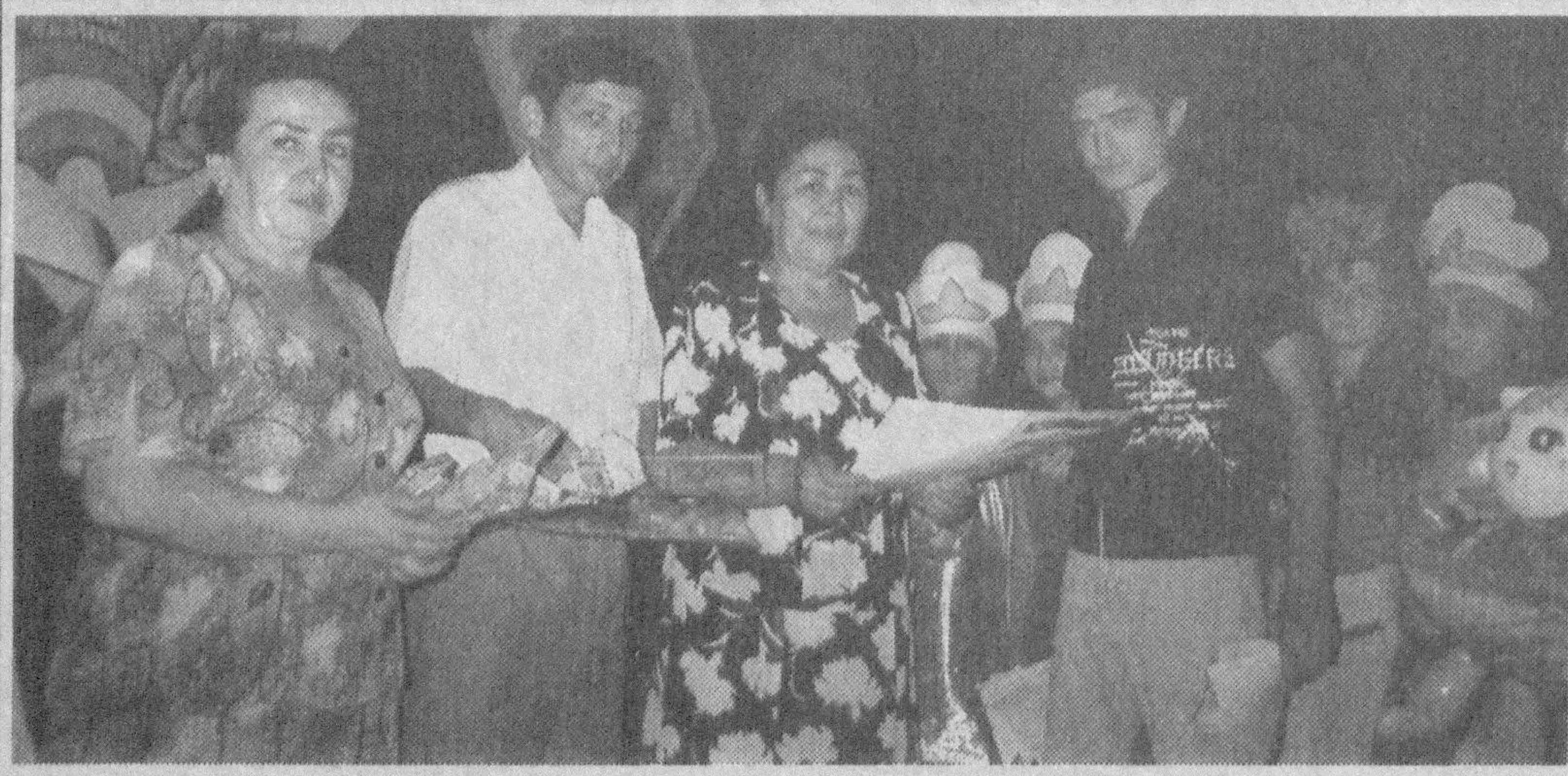
Суратда: Партия аъзолари болажонларга совға улашмоқда.

Мустиқалгимизнинг илк йиллариданоқ Орол- бўйи болалари ва «Меҳ- рибонлик уйлари» ўқув- чиларининг Ўзбекистон- нинг оромбахш дам олиш масканларида соғлом-