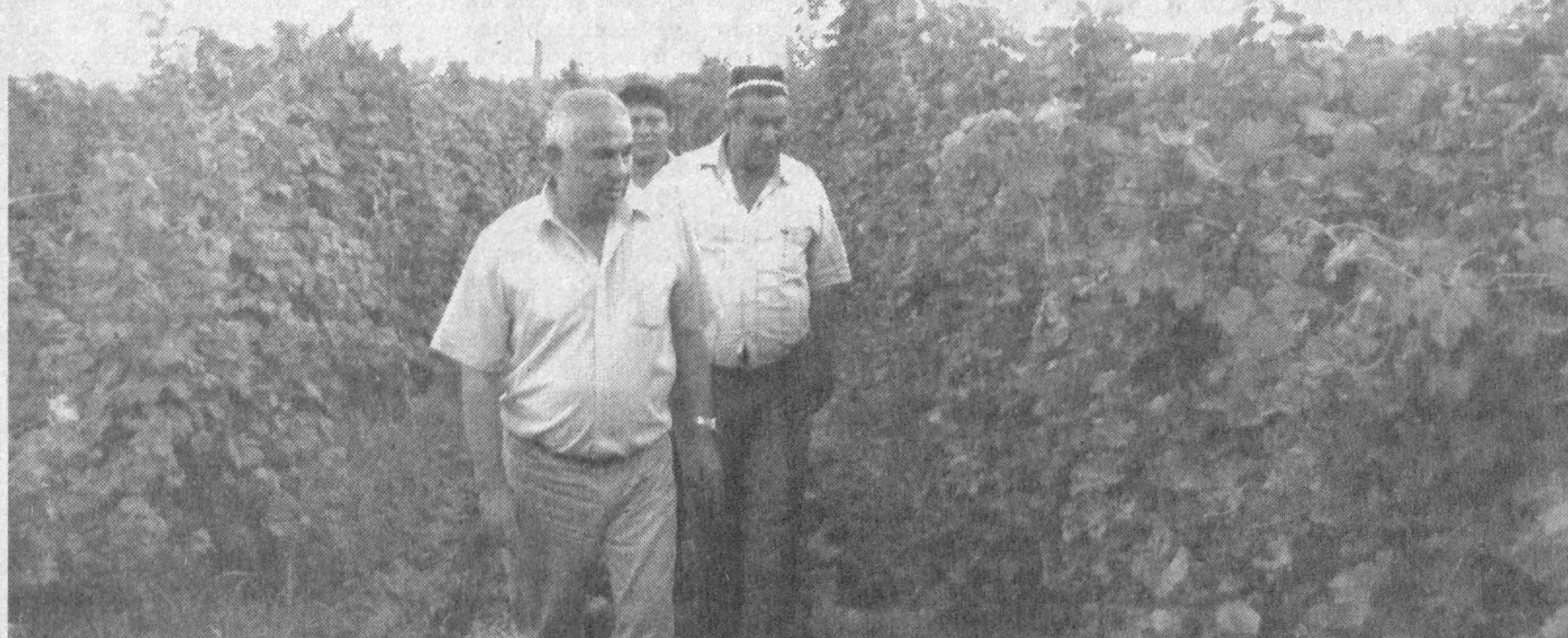
ШАРБАТГА ТЎЛДИ БОҒЛАР

Кун кеча Ўзбекистон Республикаси Олий Мажлис Қонунчилик палатасидаги «Миллий тикланиш» партияси фракциясининг кенгайтирилган йиғилиши бўлиб ўтди. Унда Ўзбекистон Республикаси Олий Суди, Республика прокуратураси ва Республика Адлия Вазирлиги вакиллари ҳамда партия фаолирати қатнашди. Йиғилишда Республикамиз Президентининг «Қамоққа олишга санкция берилгән ҳуқуқини судларга ўтказиш тўғрисида»ги Фармони муҳокама этилди. (Ўз мухбиримиз)