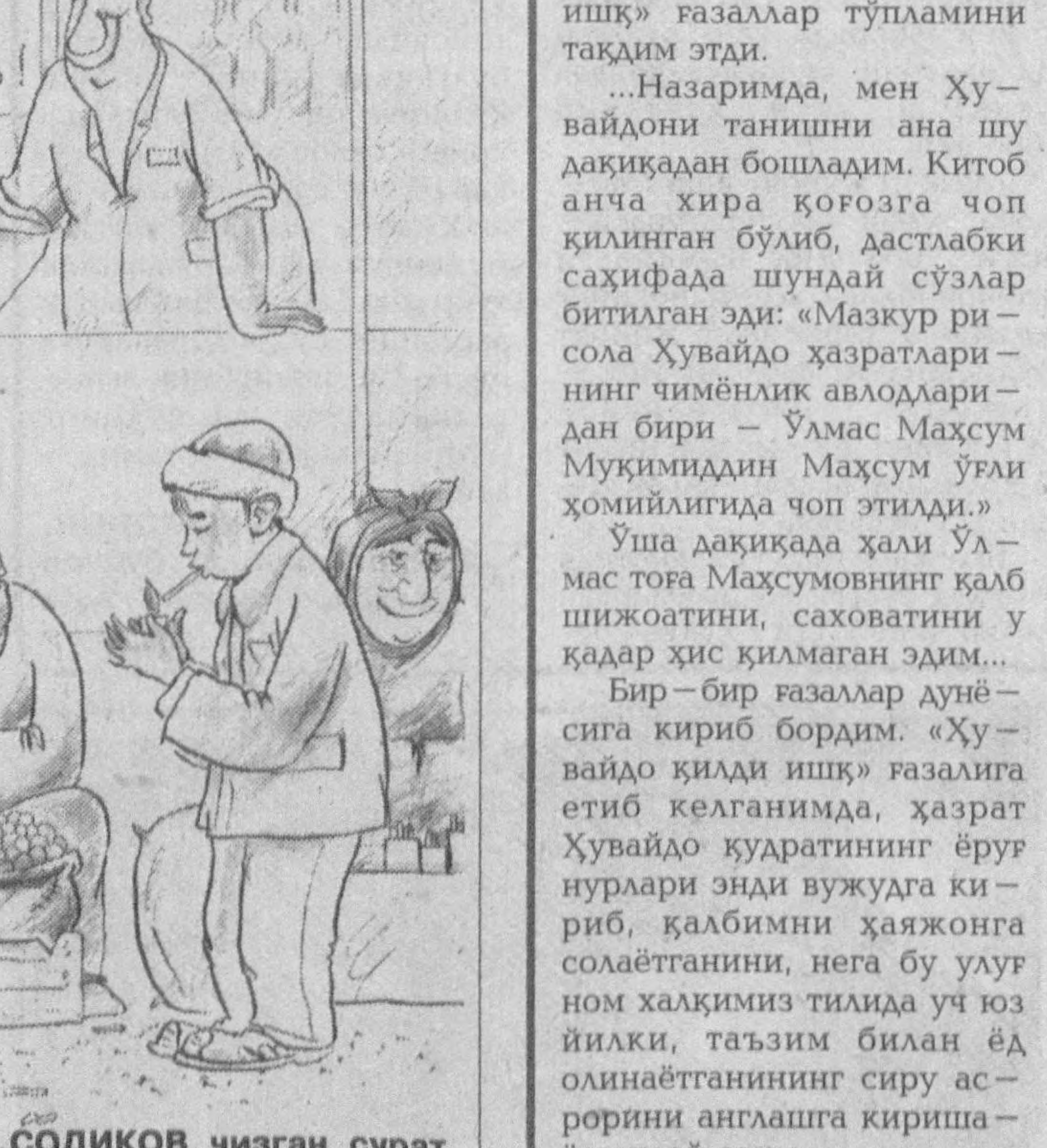
Х.СОДИҚОВ чизган сурат