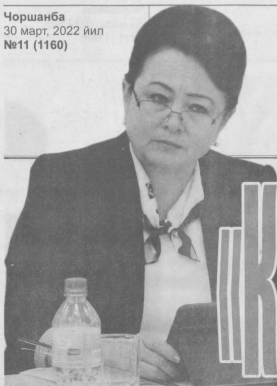
Зумрад БЕКАТОВА, Олий Мажлис Қонунчилик палатаси депутаты