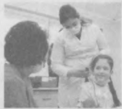
«Замин» жамғармаси билан ҳамкорликда заиф эшитувчи 2 мингдан зиёд болалар рақамли эшитиш мослаамалари билан таъминланди.